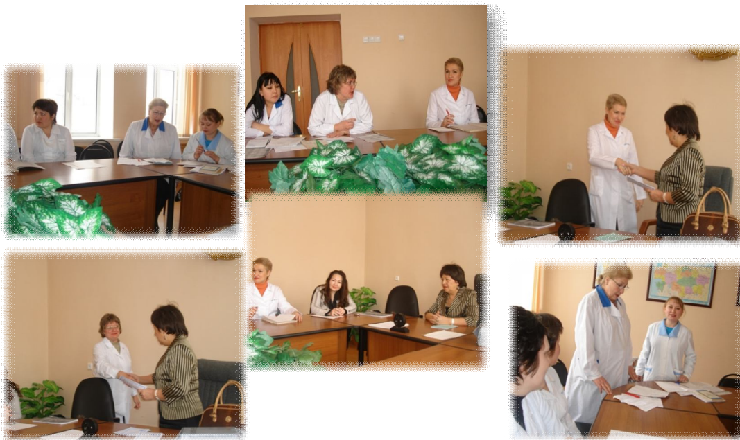
Слушатели курсов по обучению государственного языка в Восточно-Казахстанском филиале ГУ Центр судебной медицины Министерства Здравоохранения РК (2009 г.)