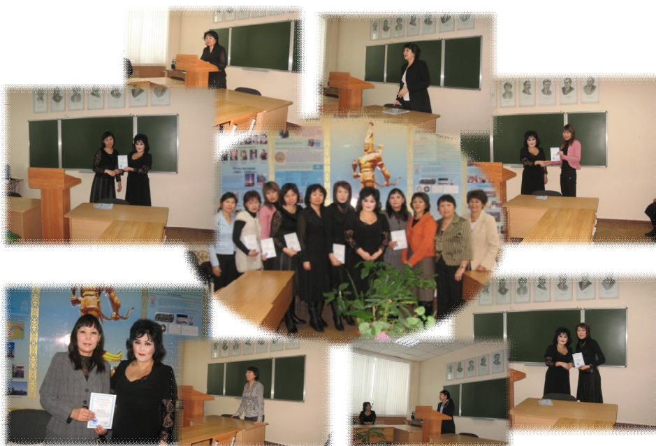
В 2010 году с 3-13 января в научно-практическом центре «Руханият» был проведён областной научно-практический семинар на тему «Обучение казахского языка на основе инновационной технологии».