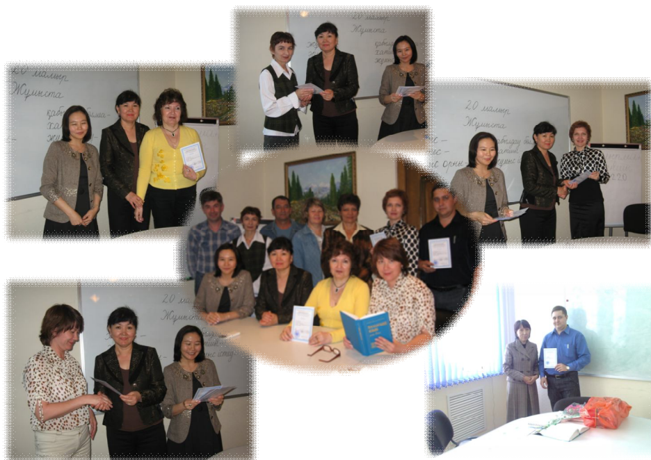
Слушатели курсов ТОО «AES Согринская ТЭЦ» (2008, 2009, 2010 г.г.)